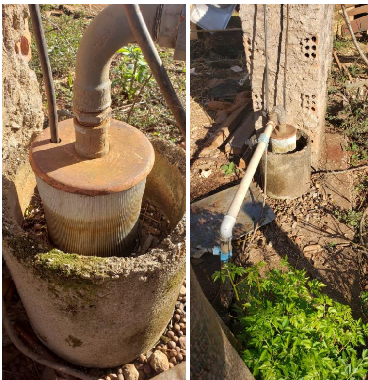
Figura 1: Situação atual do poço existente na Comunidade Santa Rita –Água Santa/RS

Com essas informações acima, é possível inferir sobre situação geológica local e dimensionar possível perfil construtivo para o poço a ser perfurado/executado.